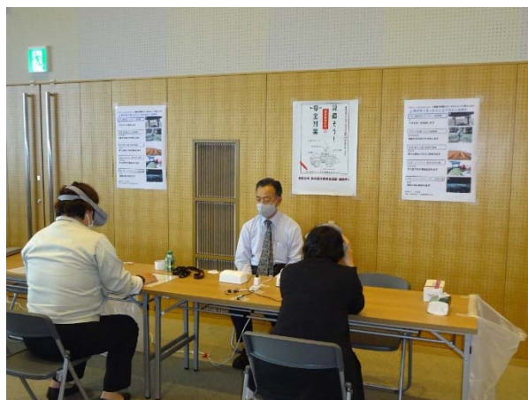
VR 動画による農作業事故体験の実施の様子