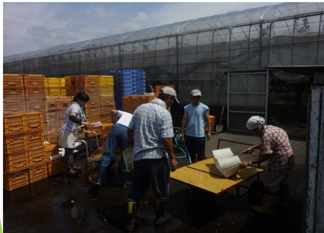
福祉施設の利用者さんがコンテナ洗浄中