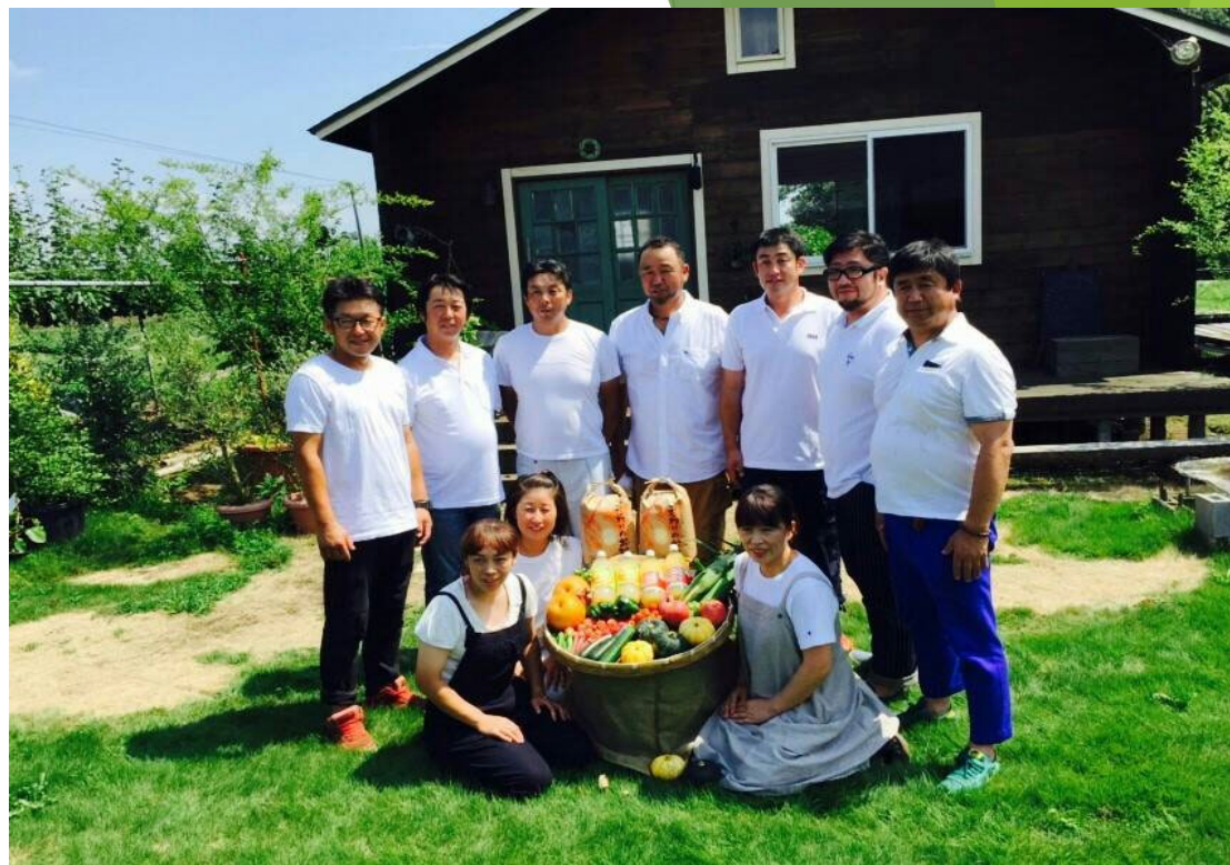
Zuttoきよはらのメンバー